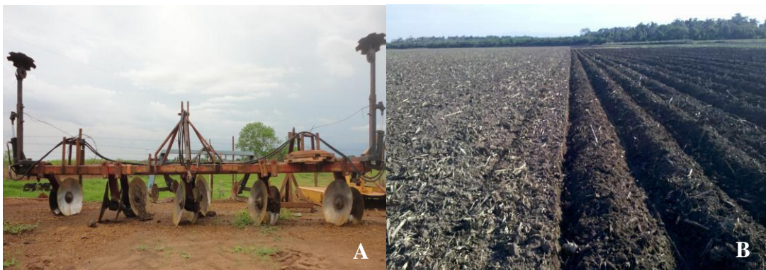
FIGURA 2. Construção do sistema de sementeira em camalhões. A – camalhoeira. B - camalhões. Itaporã-MS, Fazenda Águas da Fortuna, 2011.

Para a elevação dos camalhões foi utilizado um implemento denominado camalhoeira que possui chassi simples, com oito pares de discos disposto entre si com espaçamento de 1,00 m de distancia, formando quatro camalhões de um metro cada por passada (Figura 2).