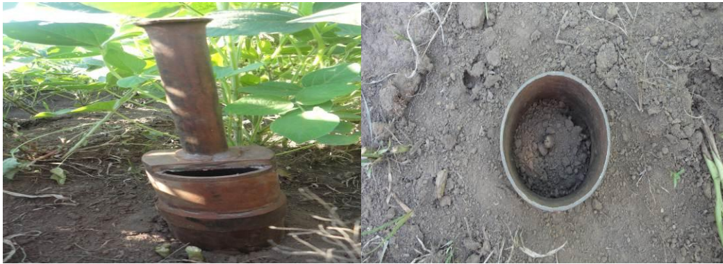
FIGURA 4. Amostrador de solo. Itaporã-MS, 2011.

No estágio R8 foram realizadas as seguintes determinações: contagem de população final, por meio da contagem de 1 m de linha de semeadura nas duas linhas centrais, transformando-se para metro linear.