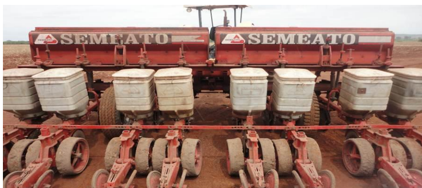
FIGURA 3. Semeadora utilizada na semeadura em camalhões. Itaporã-MS, 2011.

Antes da semeadura foi realizada uma aplicação de herbicidas na área. A adubação utilizada foi de 300 kg ha -1 de adubo químico formulado 02-20-20. As sementes foram tratadas com 200 mL pc. ha -1 Fipronil+Vitavax-Thiram, 80 mL ha -1 CoMo. As sementes de soja foram inoculadas 45 minutos antes da semeadura com inoculante á base de turfa, contendo as bactérias Bradyrhizobium elkani (Estirpe Semia 5019) e Bradyrhizobium japonicum (Estirpe Semia 5079), com concentração mínima de 5x10 9 células viáveis por grama de inoculante, na dosagem de 100g de inoculante em 50 kg de semente de soja.